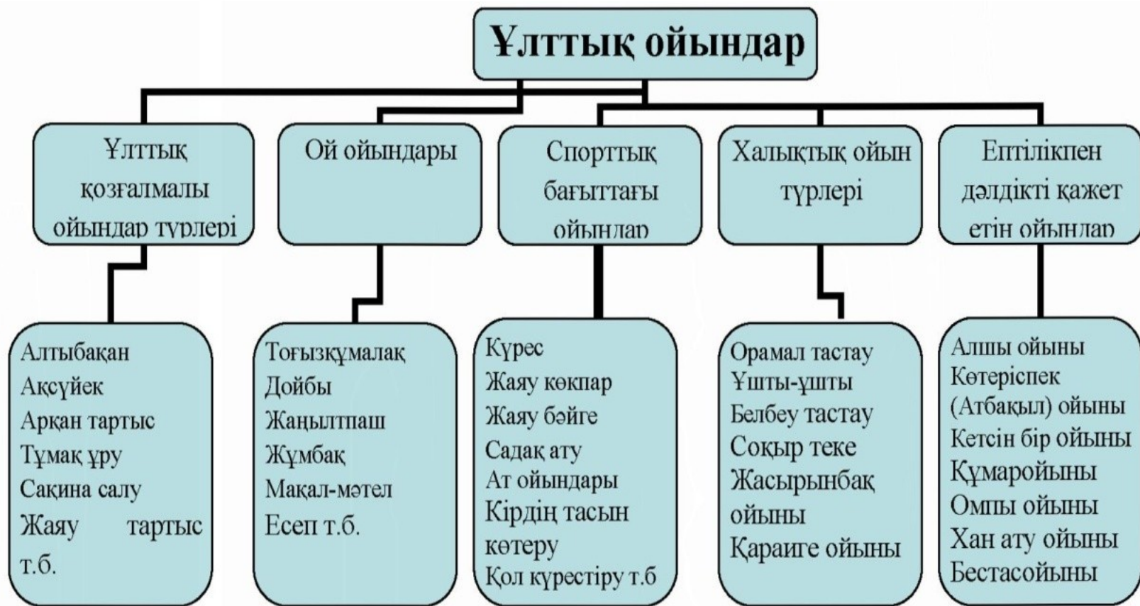
1-сурет. Ұлттық ойындарды жүйелеу, топтау